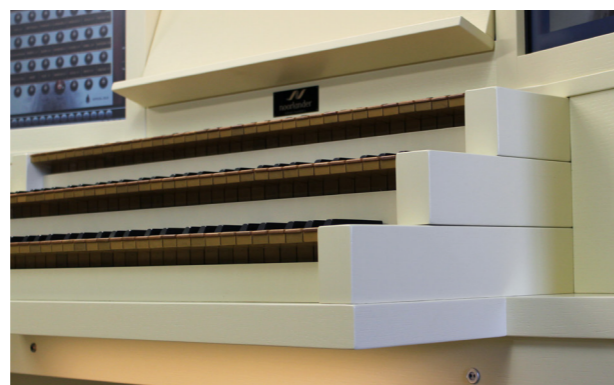
▲ Standaard met 3 klavieren

Heeft u hulp nodig? Er is mogelijkheid tot hulp op afstand via internet.