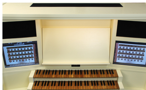
▲ Optie voor bovenluidsprekers