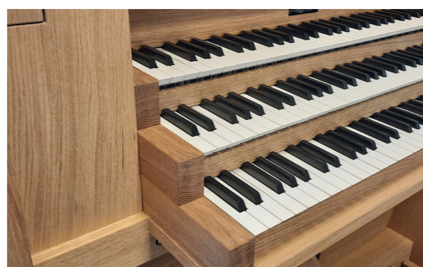
▲ Optioneel uitbreidbaar met een 3 e klavier

▼ Unieke en zeer degelijke schuifconstructie